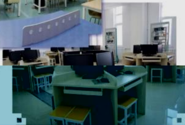
一体化课程教学设计综合实训室