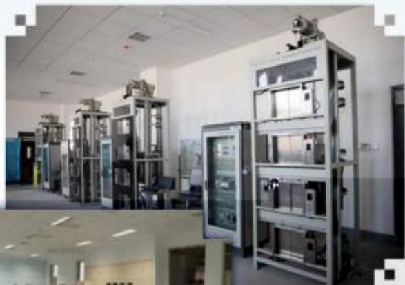
智能电梯安装调试维护训练场所